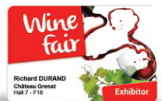
Einladungen zu Ihren Events