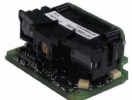
TC1200 SCAN ENGINE MODELL